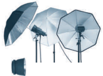
33.576.00 Focus 110 paraguas, plata Ø 110 cm 33.496.00 Reflector para paraguas 33.570.00 Plata/negro Ø 105 cm 33.571.00 Blanco/negro Ø 105 cm 33.572.00 Transparente Ø 105 cm 33.573.00 Blanco/negro Ø 85 cm 33.574.00 Plata/negro Ø 85 cm 33.575.00 Transparente Ø 85 cm