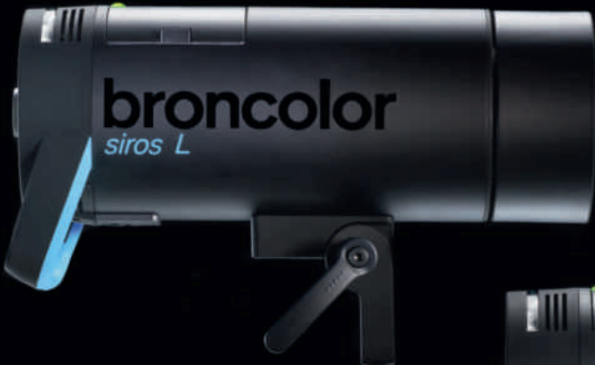
Siros 800 L