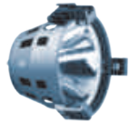
PAR Reflector para HMI F1600 43.140.00