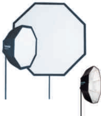
Octabox 33.600.00 Ø 75 cm 33.601.00 Ø 150 cm