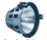
Open Face Reflector para HMI F1600 43.150.00